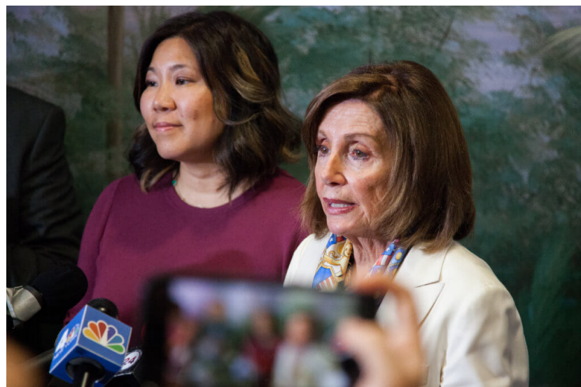
La presidenta de la Cámara de Representantes Nancy Pelosi visitó Queens para hablar sobre reforma migratoria.