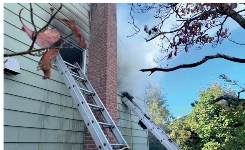
Un policía y dos buenos samaritanos salvaron de una casa en llamas a un anciano en silla de ruedas.