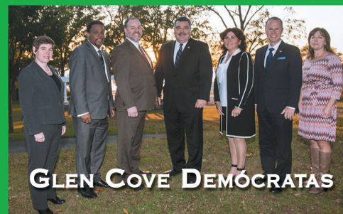
GLEN COVE DEMÓCRATAS VOTE FILA A | 7 DE NOVIEMBRE