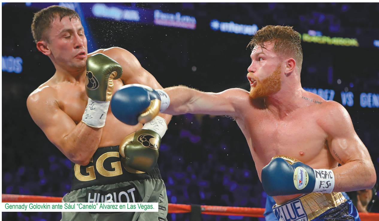
Gennady Golovkin ante Saúl "Canelo" Álvarez en Las Vegas.